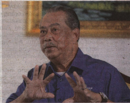
Muhyiddin mengesyorkan sejak Oktober 2021 supaya pintu sempadan negara dibuka.