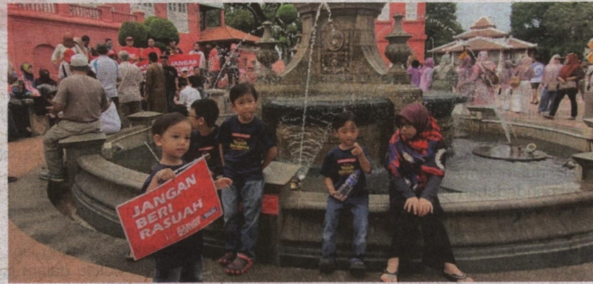
Melaka kembali dimeriahkan dengan kehadiran pelancong luar dan tempatan, sekali gus meningkatkan semula ekonomi negeri selepas pandemik.

Sektor pelancongan antara yang paling terjejas akibat pandemik Covid-19. Kawalan pergerakan dan penutupan sempadan negara bagi mengawal penularan virus Covid-19 telah menjelaskan pendapatan pengusaha sektor ini.